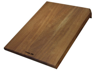
滑动伊罗科木砧板 8656 001